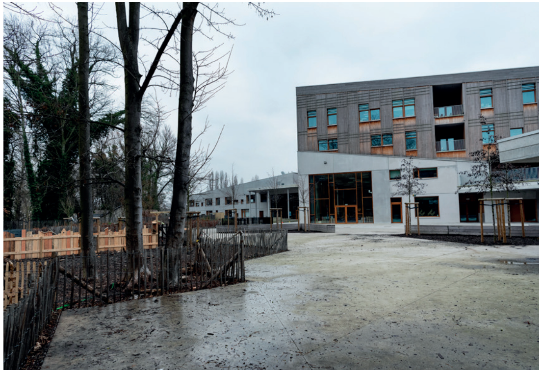
3. SCHOLENCOMPLEX 'À LA CROISÉE DES CHEMINS'

Deze wandelroute neemt je mee langs ambitieuze infrastructuur, kleine verhalen en verrassend groen.