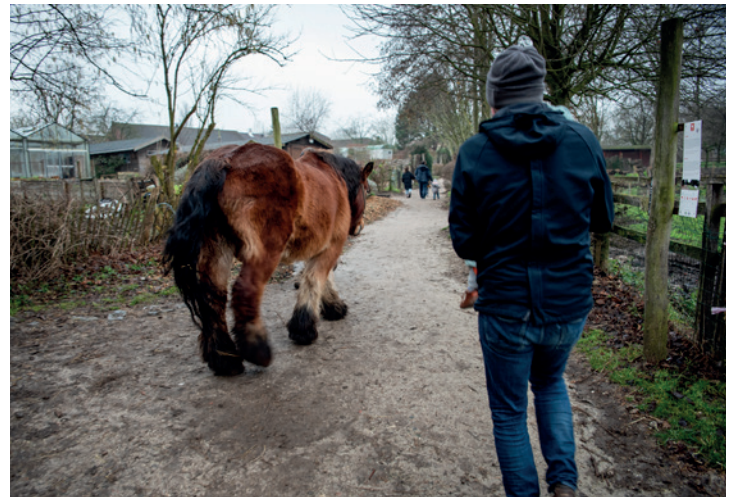
24. FERME NOS PILIFS

Om zich voor te bereiden op een sterke bevolkingsstijging lanceerde de Stad Brussel in 2005 een '1000 Woningen Plan'. De Grondregie en het OCMW van de stad zouden duizend huurwoningen bouwen, zowel aan