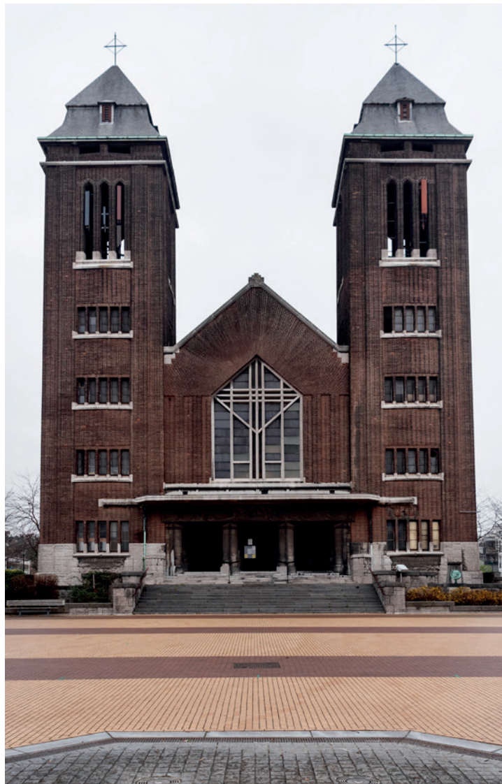
10. SINT-PIETER EN PAULUSKERK

→ Loop rond de kerk, kom terug naar het Peter Benoîtplein, steek de Vekemansstraat over naar de IJzerkruisenlaan en volg die, opnieuw langs een groot scholencomplex. Neem de Leo XIII-straat naar links, steek bij de rotonde de Oorlogskruisenlaan over en neem rechtdoor de Driegatenstraat. Je komt aan het Meudonpark.