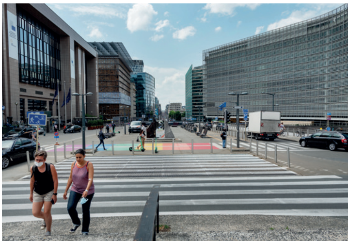
19. RUE DE LA LOI