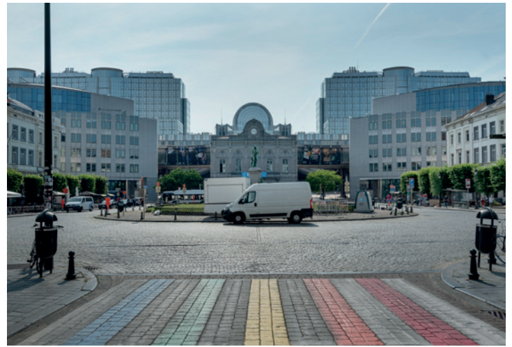
2. LA PLACE DU LUXEMBOURG

Aujourd'hui, c'est l'UE qui occupe ce bâtiment : elle en fait son centre d'informations. L'entrée principale