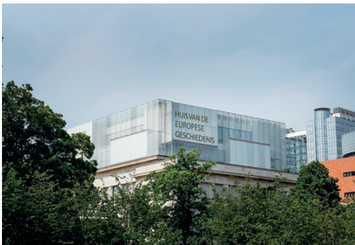
9. BÂTIMENT EASTMAN

illustrent les fables de La Fontaine. Elles étaient là pour distraire les enfants. La construction récente du cube en verre (Chaix & Morel, 2017) s'est avérée nécessaire pour donner au bâtiment un hall central éclairé verticalement, autour duquel, à différents étages, des centaines d'objets emblématiques révèlent l'histoire de l'Europe.