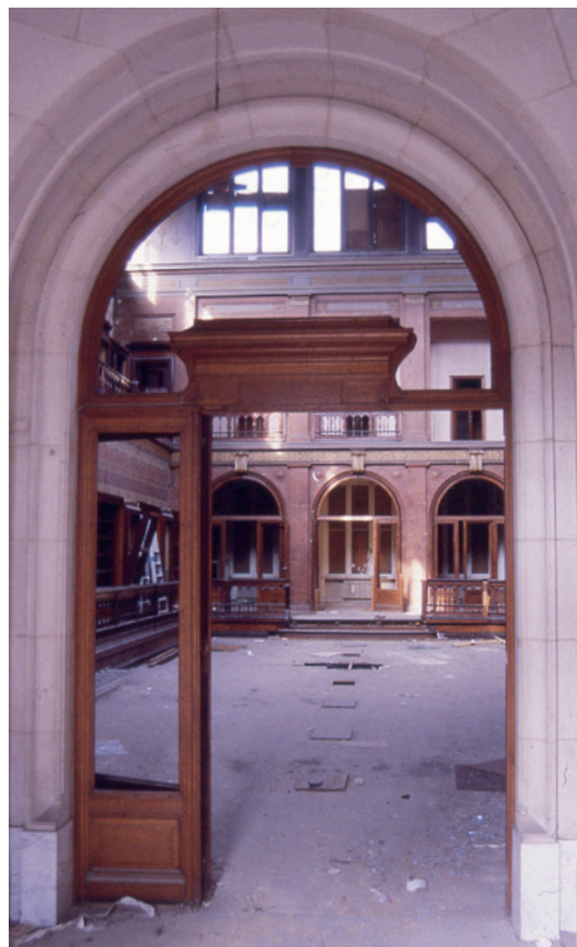
LA BIBLIOTHÈQUE SOLVAY DANS LE PARC LÉOPOLD, AVANT SA RÉNOVATION DANS LES ANNÉES 1990, VOIR 7

Contrairement au quartier du même nom, le parc a des allures de légèreté et de romantisme. Ici, le damier a fait place à des sentiers sinueux, à de grands dénivelés, à des vues et contrastes surprenants. L'architecte de la Cour Alphonse Balat et Louis Fuchs ont aménagé ici, vers 1850, le premier parc paysager de Bruxelles, avec un jardin zoologique et un jardin des plantes destinés aux riches habitants du quartier Léopold. Le zoo n'avait aucune prétention scientifique. Des ours polaires et des ours bruns vivaient côte à côte. Des chamois, des gazelles et des cerfs se baladaient dans un paysage de type 'suisse' avec un chalet. Mais de nombreuses espèces exotiques n'ont pas survécu aux hivers rigoureux, comme la girafe qui a souffert de rhumatisme à cause du sol humide de la vallée... En 1880, l'endroit a été définitivement fermé, et avec le soutien financier de l'industriel Ernest Solvay (1838-1922) il a été transformé en parc scientifique pour l'Université Libre de Bruxelles (ULB). L'Institut de Sociologie (bibliothèque Solvay) devant vous était l'une des