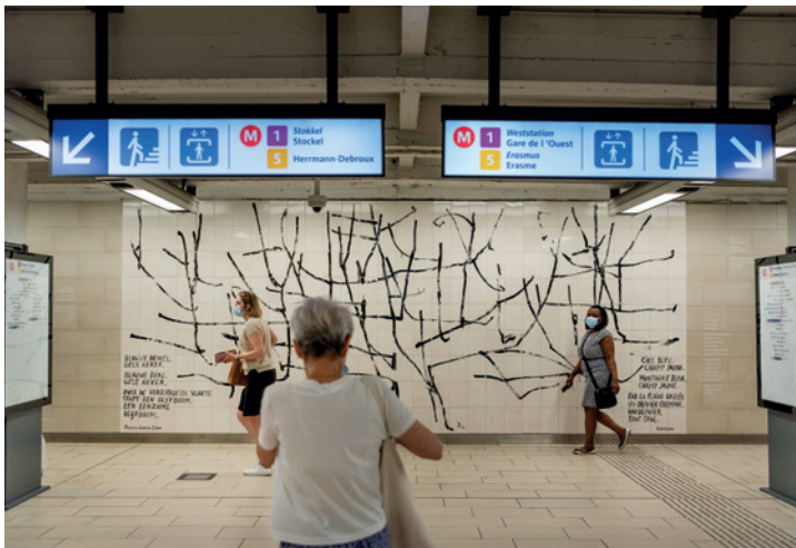
13. MÉTRO MAELBEEK

vision de la mobilité qui explique pourquoi la voiture continue à dominer le quartier. À l'entrée du métro, l'œuvre artistique de Benoît van Innis rappelle les attentats terroristes de 2019. L'artiste a dessiné un olivier sur des carreaux blancs en céramique, assorti d'une citation du poète espagnol Federico García Lorca.