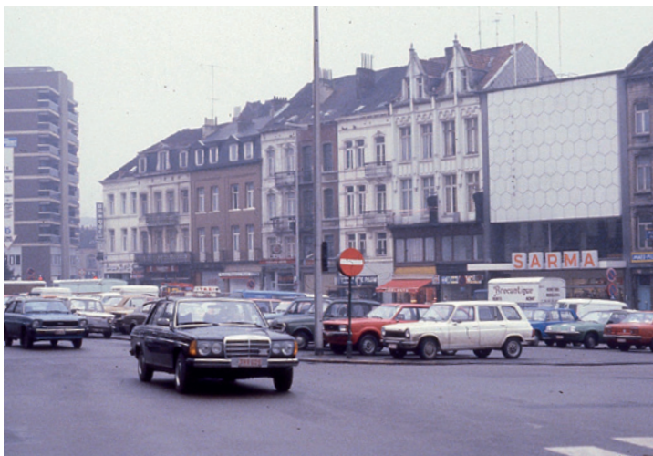
8. PLACE JOURDAN (1985)

pendant des années l'enjeu d'une lutte entre habitants et promoteurs immobiliers. Le plan d'affectation de 1968 définissait notamment la possibilité de construire de hauts immeubles de bureau de ce côté-ci de la rue Belliard. Des spéculateurs ont alors acheté un grand nombre de bâtiments et les ont laissés déperir, ce qui a favorisé leur occupation par des squatteurs. On peut se réjouir qu'un hôtel y ait finalement été construit, et non un immeuble de bureaux. Le récent réaménagement de la place pour la rendre en grande partie piétonne a cependant dû faire face à la méfiance de plusieurs commerçants et de politiques locaux, mais aujourd'hui cette décision porte ses fruits. La friterie Maison Antoine s'est vue dotée d'un nouveau pavillon. La place Jourdan revit à nouveau, mais la gentrification s'y fait plus que jamais ressentir. Les prix des locations en hausse attirent un public plus aisé - assez homogène - et les magasins de quartier ont fait place à des boutiques plus branchées.