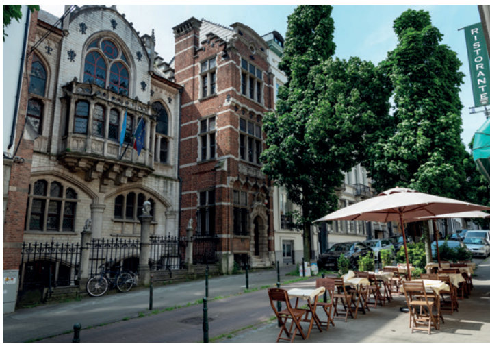
12. RUE DE TOULOUSE

→ Suivez la chaussée d'Etterbeek et passez sous le pont de la rue de la Loi.