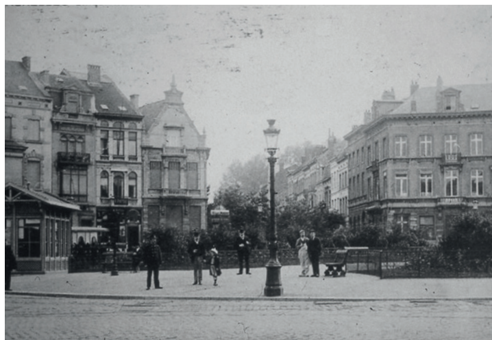
21. ROND-POINT SCHUMAN (1910)

l'œuf qui comporte des salles de taille variable. La plus centrale est tellement grande que tous les chefs de gouvernements de l'UE peuvent s'asseoir autour de la table. La réalité sur le chantier a toutefois été bien moins glorieuse : des ouvriers du bâtiment, souvent sans papiers et avec de mauvais contrats (parfois pas de contrats du tout), mal logés, ont travaillé de trop longues heures dans des conditions plus que difficiles pour des salaires de misère. Certains ont lancé des procédures longues de plusieurs années pour, au final, ne pas recevoir ce à quoi ils avaient droit.