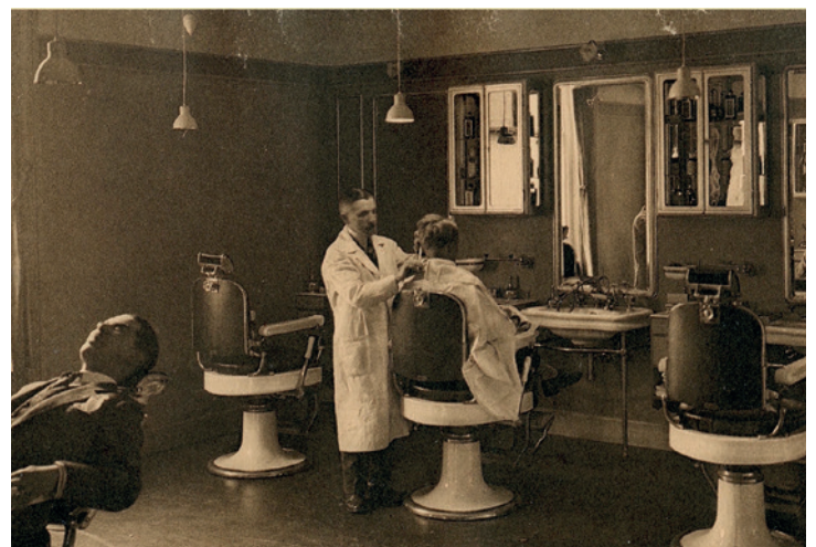
11. RÉSIDENCE PALACE (1930)

confort moderne dans le chef de la noblesse et de la haute bourgeoisie. C'était une alternative aux maisons traditionnelles du quartier Léopold. Les prestations de services étaient mises en avant : service de voiturier, traiteur, gare ferroviaire, piscine, terrains de tennis. Tout était là pour dorloter les résidents. Les appartements étaient dotés de tout le confort nécessaire, avec une cuisine et une salle de bain modernes en guise de carte de visite. Pourtant le Résidence Palace n'a pas pu résister à la concurrence de l'exode urbain et certaines parties ont rapidement été transformées en bureaux. Ce n'est que très récemment qu'une aile a été à nouveau rénovée en studios de luxe.