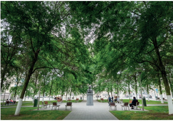
15. GROEN VOORPLEIN

links van het koor wordt de Heilige Rita, patrones van de hopeloze gevallen, met zorg en ijver vereerd. De westfaçade van deze kapel is de heropgebouwde barokke voor-gevel van de Sint-Annakapel die in 1957 afgebroken werd voor de verbreding van de nabij gelegen Bergstraat. Niet toevallig een jaar voor hét startpunt van het mas-satoerisme in Brussel: Expo 58. Het historische centrum werd vanaf dan verbouwd tot een 'authentiek' decor waar toeristen zich aan kunnen vergapen.