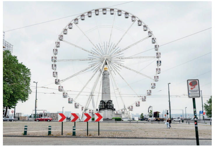
5. PANORAMA POELAERTPLEIN

Sinds de jaren 1960 worden de gerenoveerde salons en zalen (rechts achter het hek) gebruikt door de Belgische diplomatie; de bijhorende tuinen werden al na WO I een publiek park. Het is aangelegd in Engelse landschapstijl, met romantisch kronkelende paadjes, verborgen hoekjes en standbeelden. Iets verderop links ligt een heerlijk terras rond de voormalige oranjerie (wintertuin). Onder de eeuwenoude bomen zou je bijna vergeten