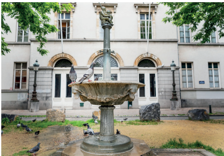
20. GROOT GODSHUIS

trappartij af naar de Komedian-tenstraat, die luw maar niet erg verwelkomend is. Steek de Broekstraat over naar de Kreupelenstraat en volg het brede voetpad rechts. Sla aan de Zilverstraat rechtsaf naar het Martelaarsplein.