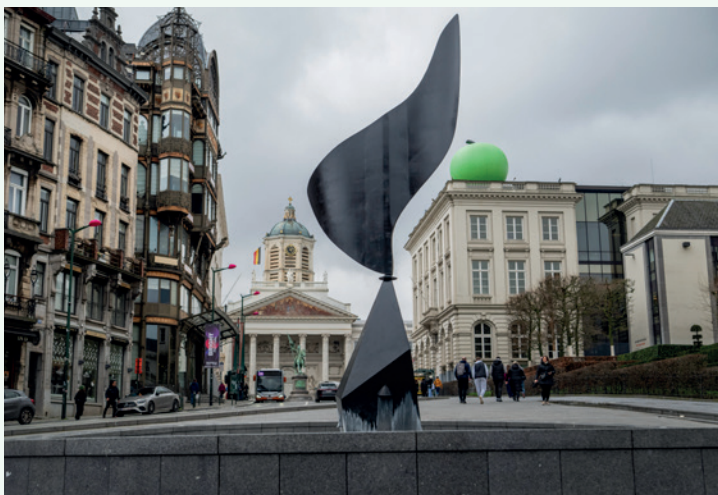
THE WHIRLING EAR

→ Steek de Ravensteinstraat over en volg ze naar rechts. Net voorbij Bozar vind je links een trap naar beneden. Kijk eens over de reling.