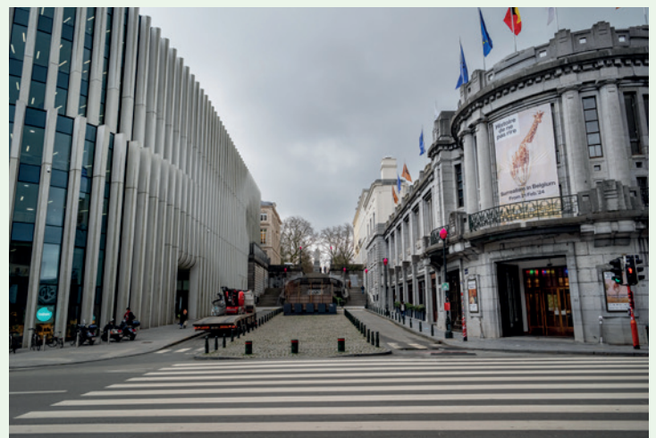
BNP PARIBAS FORTIS EN BOZAR

Rechts strekt het met vlaggenmasten bekroonde Paleis voor Schone Kunsten (1928, sinds 2002 'Bozar') zijn wortels heel wat dieper uit dan het straatniveau doet vermoeden. Onvoorstelbaar wat architect Victor Horta hier op acht niveaus ineen puzzelde! Een grote concertzaal met 2200 zitplaatsen, een kamermuziekzaal voor 600 toehoorders, talloze kleinere zalen, een uitgebreid tentoonstellingscircuit en verschillende ontmoetingsruimten die alles verbinden. De grootste orkesten en solisten treden hier op, terwijl er permanent kunstexposities van internationale kwaliteit lopen. Net zoals in het Centraal Station moeten de winkels aan de straatzijde het gebouw integreren in het stadsweefsel. Je vindt er ook het populaire caf  Victor.