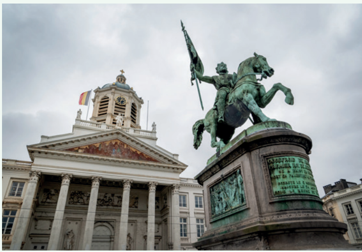
GODFRIED VAN BOUILLON

→ Stap naar het standbeeld in het midden van het plein. Opgepast voor het drukke verkeer!