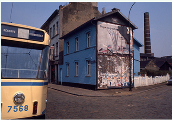
BLAUW HUIZEKE (1975)

en de bibliotheek van het centraal gelegen maar afgetakelde buurthuis Millénaire/Millennium, dat ook maaltijden en activiteiten aanbiedt.