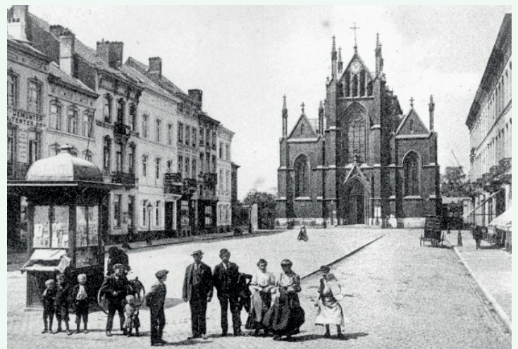
OUDE SINT-ROCHUSKERK (1910)

Na de afbraak van de Noordwijk aan het eind van de jaren 1960 (zie verder) zouden er links en rechts in deze straat hoge kantoorstorens komen. De economische crisis van de jaren 1970 stak daar een stokje voor. Vanaf de jaren 1990 wilde de Brusselse regering opnieuw meer woningen in de Noordwijk. Het eerste appartements-