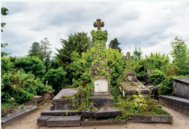
BEGRAAFPLAATS AAN DE DIEWEG